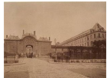
L'ospedale psichiatrico di Bicêtre, di cui Pinel fu Direttore.

di polizia medica nella Scuola di medicina di Parigi. A Pinel va rivendicato il merito di aver liberato dalle catene i malati di mente di Bicêtre e della Salpêtrière, e di aver propugnato i vantaggi della terapia psichica per mezzo del lavoro. Sostenne il nesso fra malattie mentali e alterazioni anatomiche del cervello e, per conseguenza, la necessità dell'indagine anatomopatologica cerebrale nei cadaveri dei psicopatici. Opere principali: Nosographie philosophique ou la méthode de l'analyse appliquée à la médecine , Parigi 1789; Traité médico-philosophique sur l'aliénation mentale ou la manie , Parigi 1801-09.